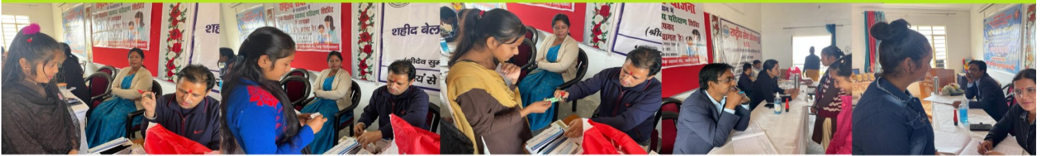
स्वास्थ्य विभाग के दल द्वारा पहले छात्रों का स्वास्थ्य परीक्षण किया उसके बाद आवश्यकतानुसार उन्हें दवाइयां भी वितरित की गयी.