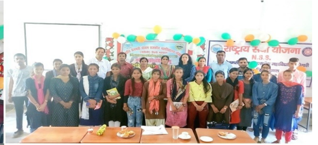
अभिविन्यास कार्यक्रम 17-08-2022