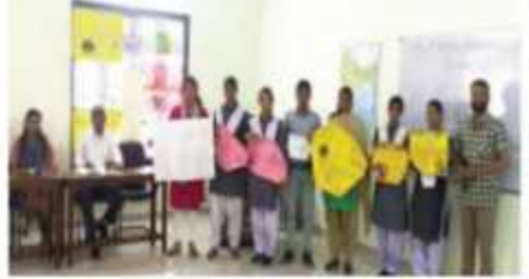
आज समाचार भेवा