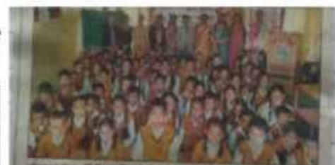
टीम ने बच्चों को जागरूक किया

नशा मुक्ति का संदेश दिया। नशा मुक्ति का संदेश दिया। नशा मुक्ति का संदेश दिया। नशा मुक्ति का संदेश दिया। नशा मुक्ति का संदेश दिया।