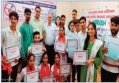
शिक्षण के माध्यम से नशे को दूर करने के प्रयास।

इतिहास। एसएमजेएनपीजी कॉलेज में नशे को दूर करने का कार्यक्रम आयोजित किया। विश्व प्रथम नशे को दूर करने के लिए युवाओं का योगदान अहम: मलेठा। कार्यक्रम के संयोजक मलेठा के युवाओं का योगदान अहम: मलेठा। कार्यक्रम के संयोजक मलेठा के युवाओं का योगदान अहम: मलेठा।