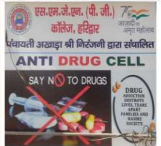
Anti Drug Cell of S.M.J.E.N. PG College organized a rally to aware the masses against the misuse of Drugs. This program was organized in collaboration with Internal Quality Assurance Cell and National Service Scheme unit.