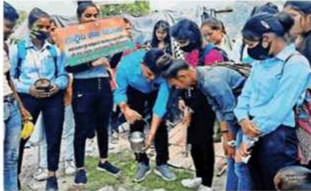
मलिन बस्ती मायाकुंड में पौधारोपण करते स्वयंसेवी