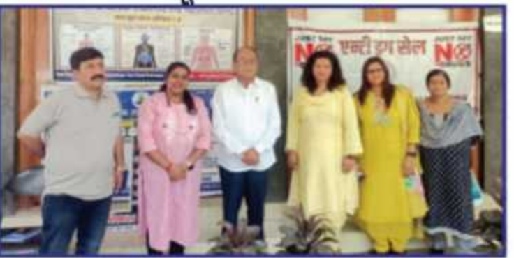
(संवाददाता प्राईम काशीपुर)

रामनगर। विश्व तंबाकू निषेध दिवस के उपलक्ष्य में पीएनजी राजकीय स्नातकोत्तर महाविद्यालय रामनगर के एंटी ड्रग सेल एवं संयुक्त चिकित्सालय, रामनगर के संयुक्त तत्वावधान में कार्यक्रम सम्पन्न हुआ।