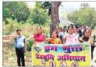
छात्राओं ने नशे के खिलाफ रैली निकाली।

अल्प विकाश : राजकीय महाविद्यालय कोटाबाग में एंटी ड्रग प्रकोष्ठ के सहकार्य में छात्राओं ने नशे के खिलाफ रैली निकाली। मुखाधार की नौ नारी महाविद्यालय परिसर में शुक्र सोमवार को नशे के खिलाफ रैली निकाली। नशे के खिलाफ रैली निकाली। नशे के खिलाफ रैली निकाली।